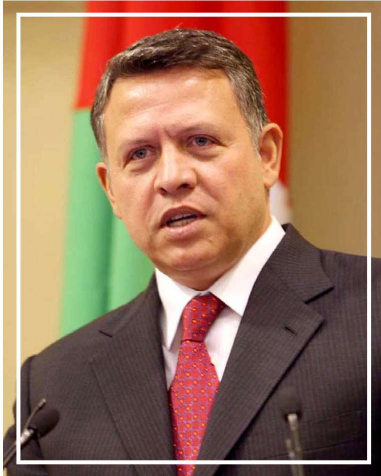
جلالة الملك عبد الله الثاني ابن الحسين المعظم