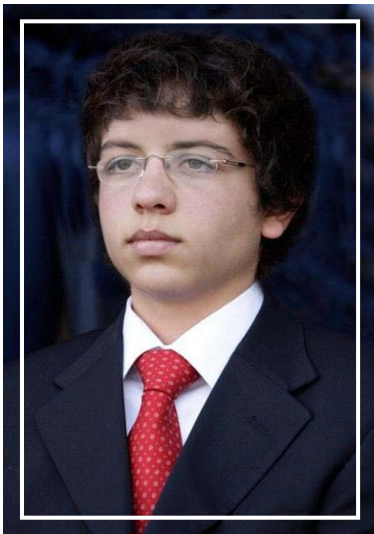
سمو الأمير الحسين ابن عبد الله الثاني المفدى